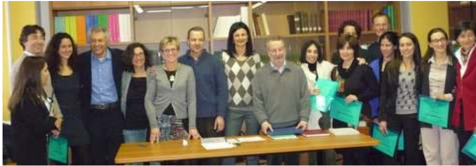
Docenti e Discenti VII Corso Triennale SIAV/ItVAS di Agopuntura Veterinaria