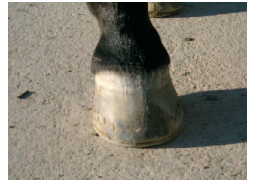
Agopunto Zu Qiaoyin

Attraverso l'esame della Chu Zhen (Palpazione), secondo la diagnosi cinese classica, si raccolgono osservazioni energetiche essenziali nel definire il tipo e l'andamento della patologia, la localizzazione della lesione o delle zone corporee coinvolte, la valutazione di quali meridiani siano implicati ed in quale parte dell'organismo l'energia viene alterata nella sua normale produzione e circolazione, ostacolando la normale funzionalità organica.