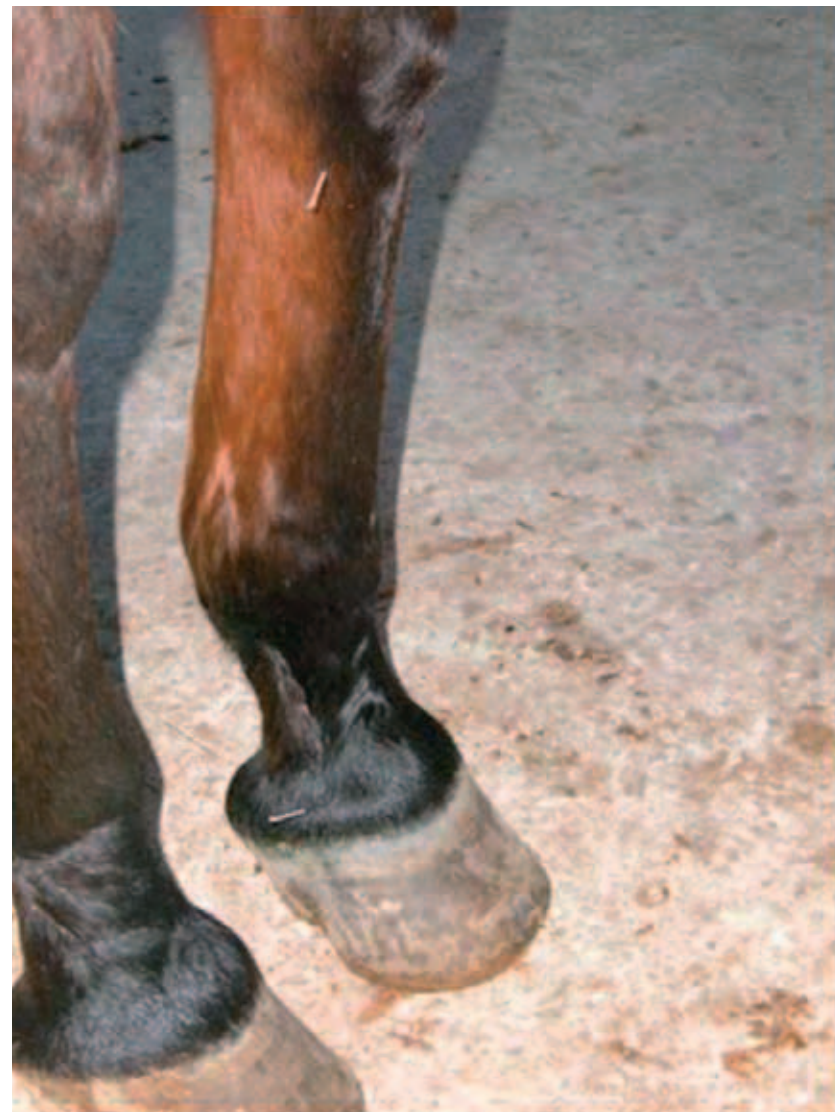
Agopunti Shangyang - Hegu (Tecnica di Rinforzo sul Meridiano)

La Medicina dello Sport è innanzitutto una medicina di tipo preventivo che svolge un ruolo fondamentale nel valutare la condizione fisica di un cavallo, nel fornire le indicazioni più corrette per la disciplina a cui esso è avviato ed a cui può sottoporsi senza rischi e nel dare tutti quei consigli inerenti l'alimentazione ed i mezzi di prevenzione e cura delle patologie connesse con tale attività. L'impegno a cui l'organismo è sottoposto durante la pratica dello sport è tale che esso necessita di un perfetto stato di salute e di efficienza fisica, e di un perfetto equilibrio psico-comportamentale.