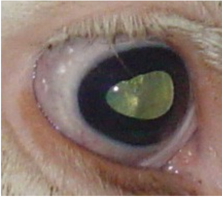
Occhio della Bovina dopo il Trattamento Agopunturale